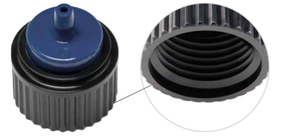
③ ½" dişi dişli