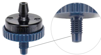
② 10-32 dişli