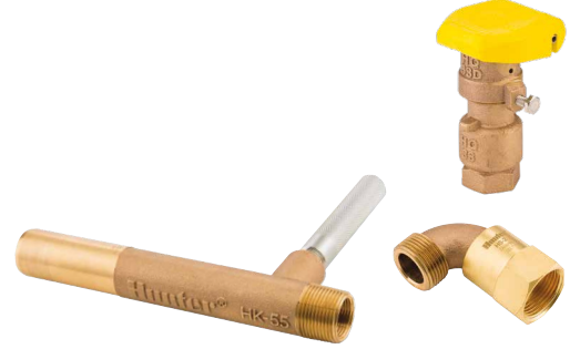
Can Suyu Vanası