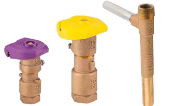
HQ-33DLRC HQ-44LRC HK-44