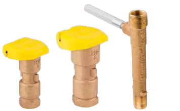
HQ-3RC HQ-5RC HK-33

Örnekler: HQ3-RC = kauçuk kapaklı HQ3 vana HQ44-LRC = kauçuk kapaklı HQ44 vana HQ44-LRC- R = kauçuk kapaklı ve mor artılmış su kapaklı HQ44 vana kilitleme kapağı HQ44-LRC-AW- R = HQ vana, kauçuk kapaklı, Acme anahtar soketi, dönme önleyici kanatlar ve mor artılmış su kilitleme kapağı HQ5-LRC-BSP = kilitlenmeli HQ5 vana kauçuk kapak ve BSP dişlileri