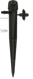
SD-B-STK Yükseklik: 15,2 cm