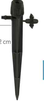
HS-B-STK Yükseklik: 15,2 cm