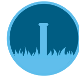
Eko Gösterge Sayfa 173